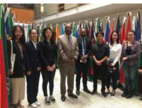
一带一路可持续发展