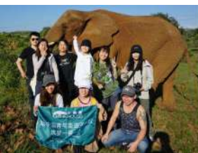
野生动物与环境保护